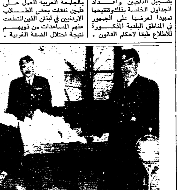
كعبة الضيفاء التي ضيفت في حوارة الى جانب التهم باقتناءها . وفي الصورة رئيس قسم شرطة محافظة اربد ومساعداه بعد اكتشاف هذه الكعبة ( تصوير كارين )

طلبات منح التأشيرات للبحار عمان - نقلت سماحة الشيخ عبد المصود السليق وزير الشؤون الدينية والايمان الخمسة بوجهة رئيس لجنة الحج مختر من السفارة السعودية في عمان حول الاسراع في تجميع شركات النقل والاصحاب جوازات سفرهم لتجهيز التأشيرات اللازمة لدخول المملكة العربية السعودية بمقد الحج لان السفارة سوف تحية عملية منح التأشيرات بتاريخ ٢٤-٢-١٩٦٨ . كما قررت لجنة شؤون الحج تحديد فترة تقديم طلبات نقل الحجاج وطلبات نادية قريفة الحج من قبل الراغبين لغاية يوم ٢٠ شوال الحالي .